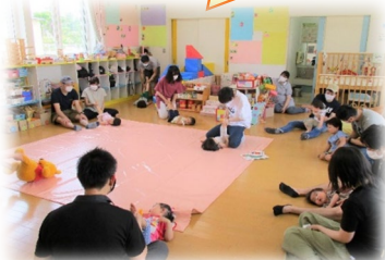
ふれあいあそびではパパにくすぐられて キャッキャ!と大喜び!