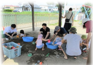
パパ、ママと一緒に砂、水あそび!