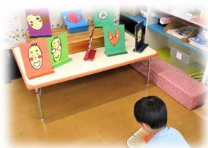
まとあて ボールを投げて「えいっ！」