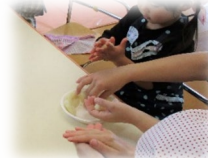
ころころ、ペタペタ たのしいね！

先日、ミニ講座で「クッキング」を行いました。 センターの畑でとれたじゃがいもで「いもだんご」をつくりましたよ！ ママと一緒に丸めてペタペタ平たくして・・・シューシュー♡ 焼きあがったいもだんごを食べ「オイシイ！」😊 おかわりもいっぱいして大満足の子も達でした！